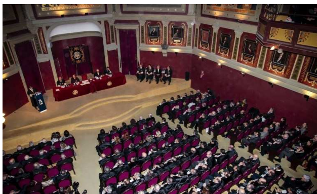
El Salón de Actos del Ateneo de Madrid estaba lleno hasta la bandera, como se puede comprobar.

Su objetivo es configurar, desde el consenso, un modelo de Administración de Justicia dentro de un verdadero Estado Social y Democrático de Derecho que permita “sacar a la Justicia del siglo XIX y llevarla definitivamente al siglo XXI”.